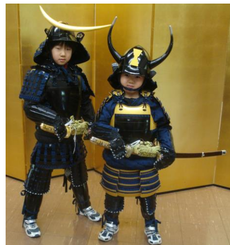
左：伊達政宗モデル