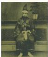
栗田寛写真(個人蔵)