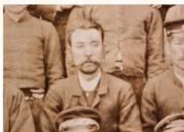
名越時孝写真(部分、当館蔵)